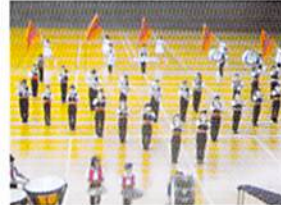
マーチングバンド