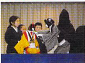
伝統文化にふれる活動